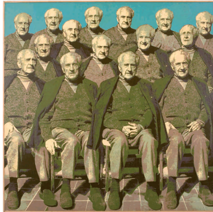
Equip d'identitat en passat, 1984

Jordi Pericot ha portat a terme una àmplia tasca investigadora i docent al voltant de la teoria de la imatge i de la comunicació, així com també de la pedagogia del disseny. La seva recerca constant al voltant del procés comunicatiu es reflecteix en les seves nombroses publicacions així com també en la seva obra artística. Els elements abstractes i reaccions sensorials descontextualitzats portaran a elements amb contingut semàntic, fins i tot pragmàtic, que incideixen en la importància del fet comunicatiu, sense ignorar, no obstant, la introducció del moviment i la reflexió en torn l'espai i el fet sensorial, així com un retorn a la figuració. L'any 1972, Jordi Pericot va representar Espanya a la Biennal de Venècia. Darrerament ha rebut la Medalla d'Or al Mèrit Cultural de la Ciutat de Barcelona.