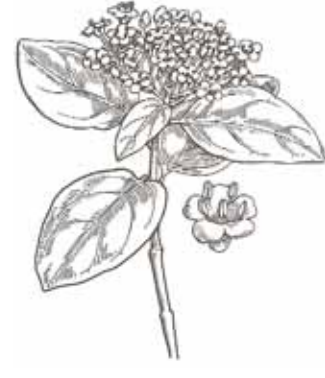
MARFULL ( Viburnum tinus )