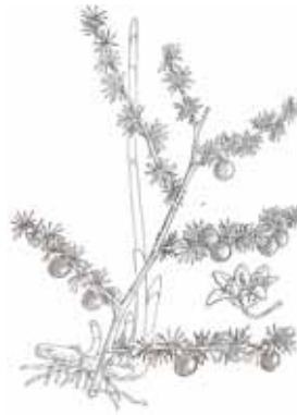
ESPARRAGUERA ( Asparagus acutifolius )