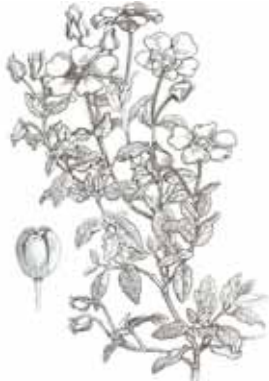
ESTEPA BORRERA ( Cistus salviifolius )