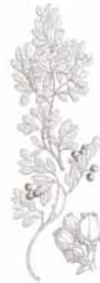
BOIXEROLA ( Arctostaphylos uva-ursi )