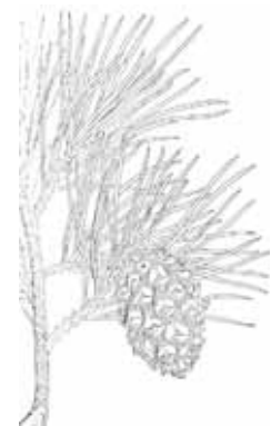
PI ROIG ( Pinus sylvestris )