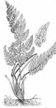
FALZIA NEGRA ( Asplenium onopteris )