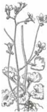
HERBA PRIMA ( Saxifraga granulata )