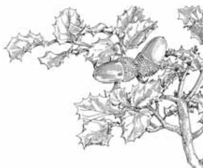
GARRIC ( Quercus coccifera )