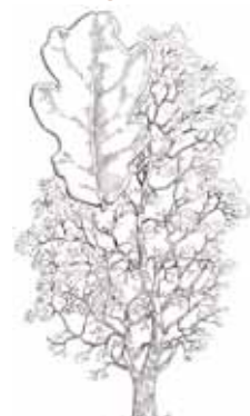
ROURE AFRICÀ ( Quercus canariensis )