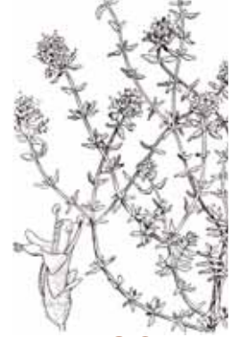
FARIGOLA ( Thymus vulgaris )