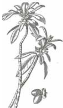
LLORERET ( Daphne laureola )