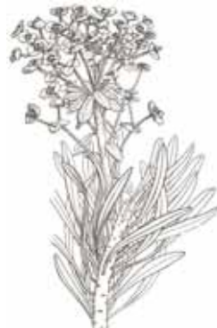
LLETERESA (Gènere Euphorbia )