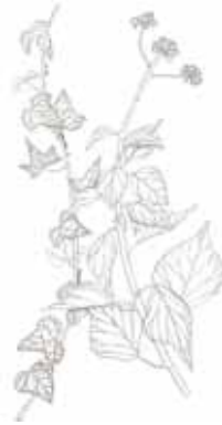
HEURA ( Hedera helix )