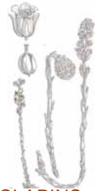
XUCLAPINS ( Monotropa hypopitys )