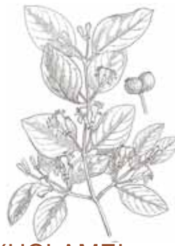
XUCLAMEL ( Lonicera xylosteum )