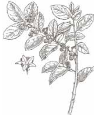
ALADERN ( Rhamnus alaternus )