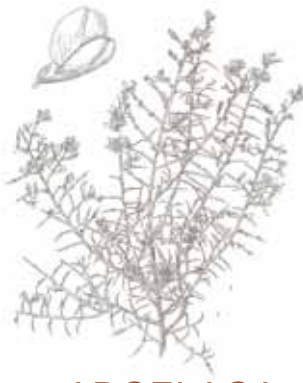
ARGELAGA ( Genista scorpius )