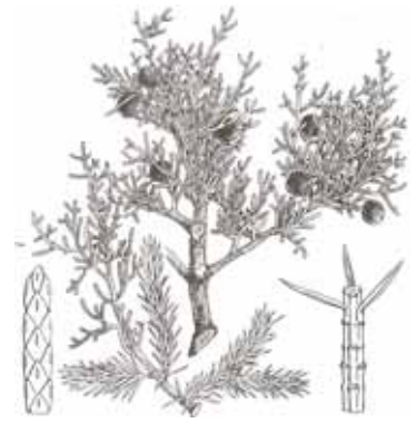
SAVINA ( Juniperus phoenicea )