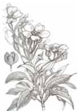
ESTEPA DE MUNTANYA ( Cistus laurifolius )