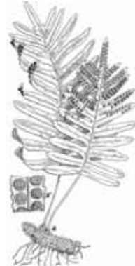
POLIPODI ( Polypodium vulgare )