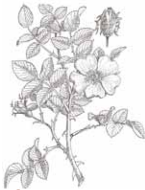
GAVARRERA ( Rosa canina )