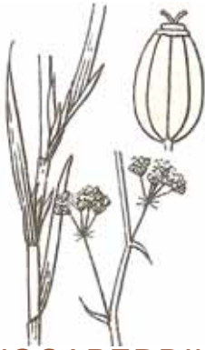
AJOCAPERDIUS ( Bupleurum fruticosens )