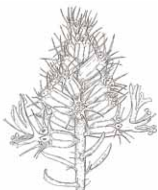
FARIGOLA BORDA ( Coris monspeliensis )