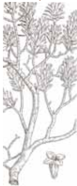
BUFALAGA ( Thymelaea tinctoria )