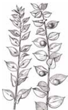
GALZERAN ( Ruscus aculeatus )