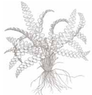
DAURADELLA ( Ceterach officinarum )