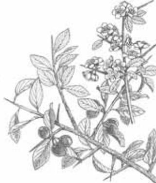
ARANYONER ( Prunus spinosa )