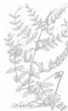
VESSES (Gènere Vicia )