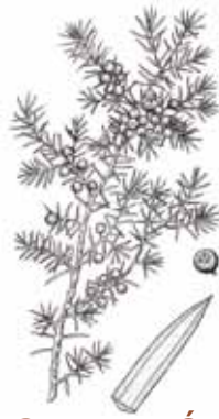
GINEBRÓ ( Juniperus communis )