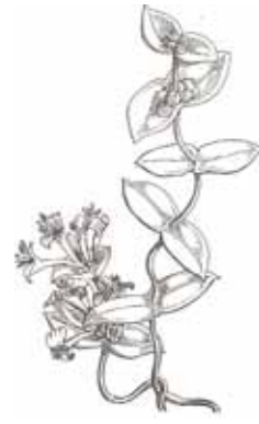
LLIGABOSC MEDITERRANI ( Lonicera implexa )