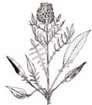
PINYA DE SANT JOAN ( Leuzea conifera )