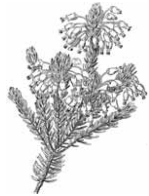
BRUC D'HIVERN ( Erica multiflora )