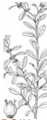
BOIX ( Buxus sempervirens )