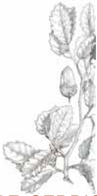
ROURE CERRIOIDE ( Quercus x cerrioides )