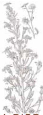
VARA D'OR ( Solidago virgaurea )