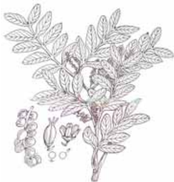
LLENTISCLE ( Pistacia lentiscus )