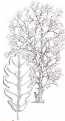
ROURE DE FULLA GRAN ( Quercus petraea )