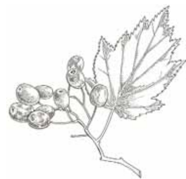
MOIXERA DE PASTOR ( Sorbus torminalis )