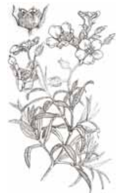
ESTEPA NEGRA ( Cistus monspeliensis )