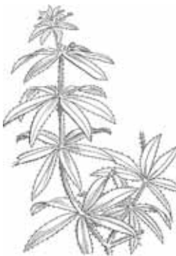
ROJA ( Rubia peregrina )