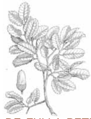
ROURE DE FULLA PETITA ( Quercus faginea )