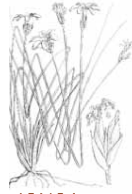
JONÇA ( Aphyllantes monspeliensis )