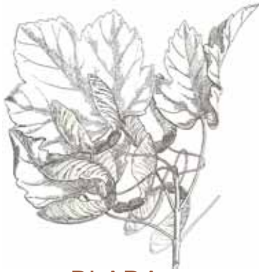
BLADA ( Acer opalus )