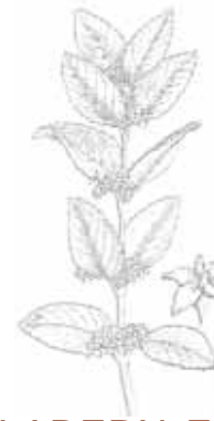
ALADERN FALS ( Phillyrea media )