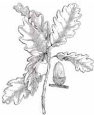
ROURE MARTINENC ( Quercus humilis )