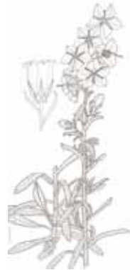
CAMPANETA BLAVA ( Campanula persisifolia )