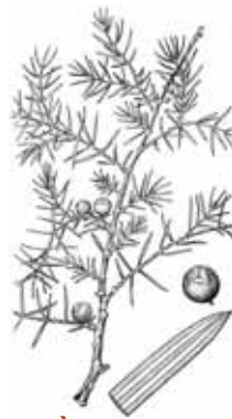
CÀDEC ( Juniperus oxycedrus )