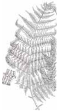
FALGUERA AQUILINA ( Pteridium aquilinum )