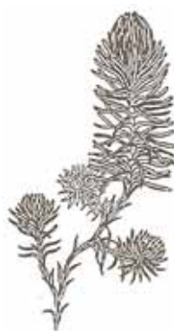
CRESPINELL RUPESTRE ( Sedum forsterianum )