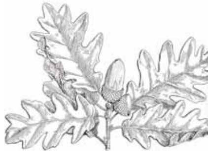
ROURE REBOLL ( Quercus pyrenaica )