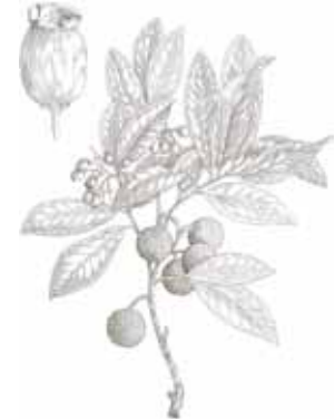
ARBOÇ ( Arbutus unedo )