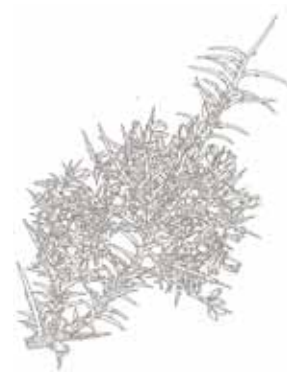
GATOSA ( Ulex parviflorus )