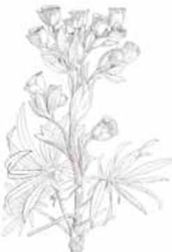
MARXIVOL ( Helleborus foetidus )