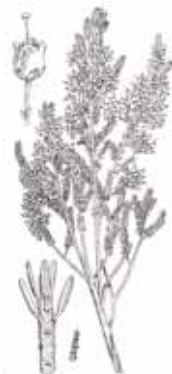
BRUC BOAL ( Erica arborea )