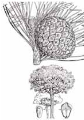
PI PINYER ( Pinus pinea )