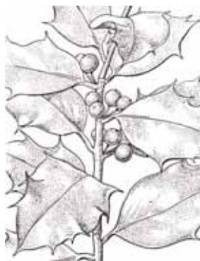
GREVOL ( Ilex aquifolium )