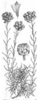
SEMPREVIVA BORDA ( Helichrysum stoechas )