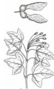
AURÓ NEGRE ( Acer monspessulanum )