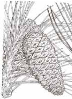
PI BLANC ( Pinus halepensis )