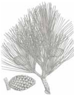
PINASSA ( Pinus nigra )