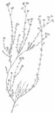
BOTJA D'ESCOMBRES ( Dorycnium pentaphyllum )