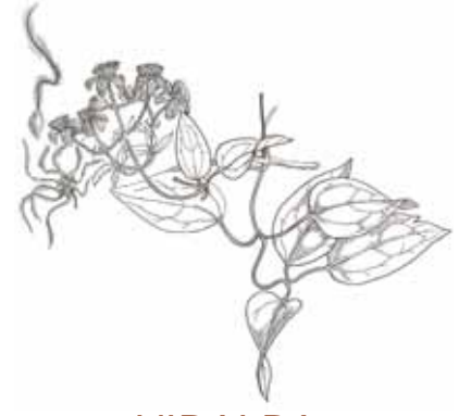
VIDALBA ( Clematis vitalba )