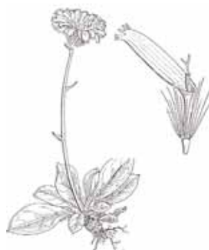
HERBA DE L'ESPARVER ( Hieracium murorum )