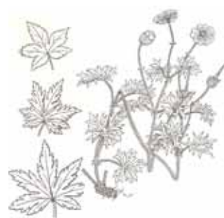
GERANIS (Gènere Geranium )