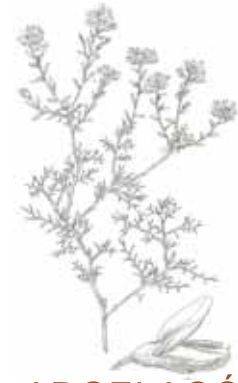
ARGELAGÓ ( Genista hispanica )