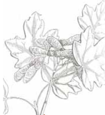
AURÓ BLANC ( Acer campestre )