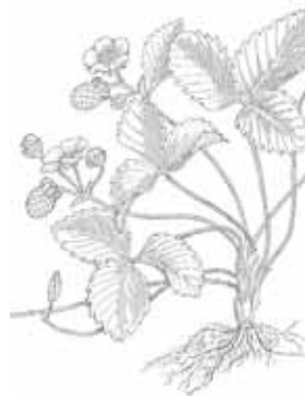
MADUIXERA ( Fragaria vesca )