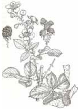
ESBARZER ( Rubus ulmifolius )