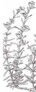
ROMANÍ ( Rosmarinus officinalis )