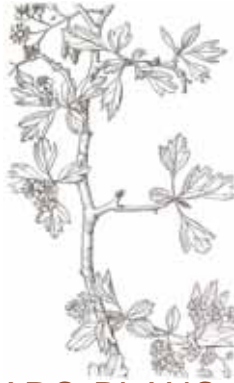
ARÇ BLANC ( Crataegus monogyna )