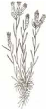
PINZELL ( Staehelina dubia )