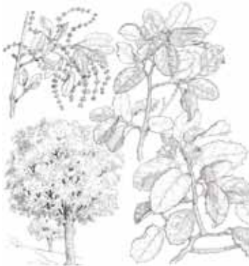
ALZINA ( Quercus ilex )