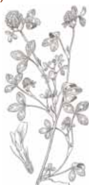
TREBOLS (Gènere Trifolium )