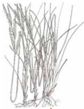
FENÀS ( Brachypodium retusum )