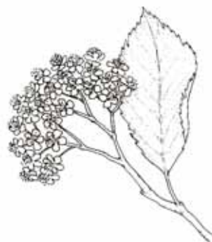
MOIXERA ( Sorbus aria )