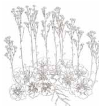
HERBA DEL NORD ( Saxifraga corbariensis )