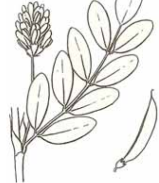
REGALÍSSIA BORDA ( Astragalus glycyphyllos )