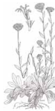
FUIYARDA ( Globularia alypum )