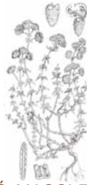
TIMÓ MASCLE ( Teucrium polium )