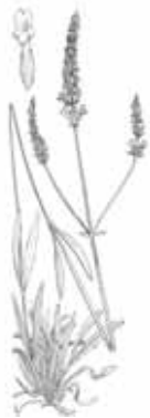
ESPIGOL ( Lavandula latifolia )