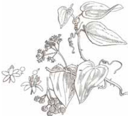
ARITJOL ( Smilax aspera )