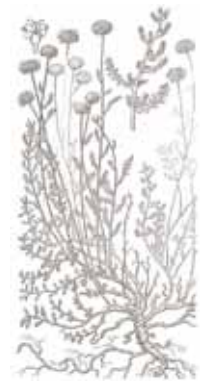
ESPERNALLAC ( Santolina chamaecyparissus )