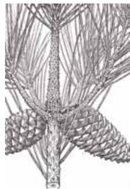
PINASTRE ( Pinus pinaster )