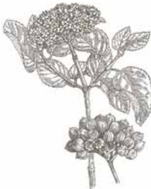
TORTELLATGE ( Viburnum lantana )