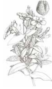
ESTEPA BLANCA ( Cistus albidus )