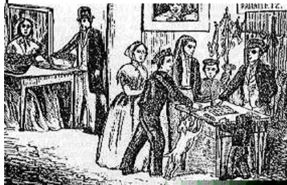
Fotografia d'una rifa de panellets