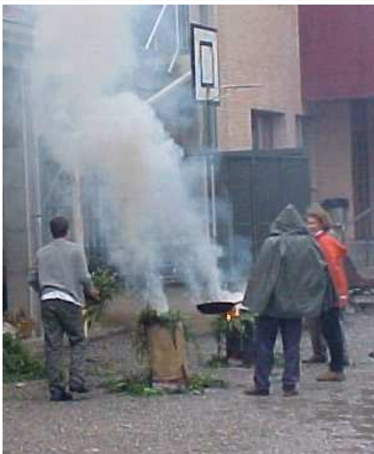
ELS CASTANYERS 31 d'octubre del 2003

Font d'informació: Costumari Català , de Joan Amades