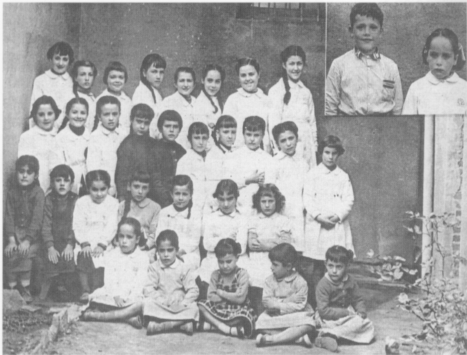
Escola de nenes. Fan més cara de bones minyones que els nens. Podem apreciar que algunes de les noies de les de la foto són calcades a les filles.