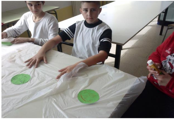
Una Filosofia que alimenta