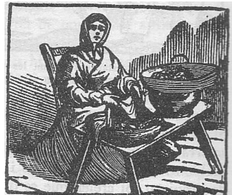
Castanyera. Il·lustració de principi del s. XX

Les castanyeres d'aquell temps vestien de manera pròpia. Duien unes faldilles de sargil molt amples i folrades, amb davantal de cànem i llana. Al cap duien una caputxa blanca de llana, molt llarga, que els arribava fins més avall de mitja faldilla. La duien lligada al coll i a la cintura.