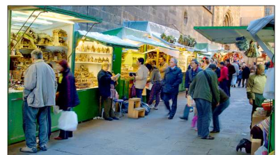
La Fira de Santa Llúcia de Barcelona

La veneració catalana per Santa Llúcia, verge i màrtir, es remunta al segle XIII. La dita popular ens indica que "De Santa Llúcia a Nadal dotze dies de cabal" i es que la seva festa se celebra el 13 de desembre. La santa és patrona de la vista i, en conseqüència, els qui més la necessiten per treballar (modistes, estudiants, etcètera) li tenen especial devoció.