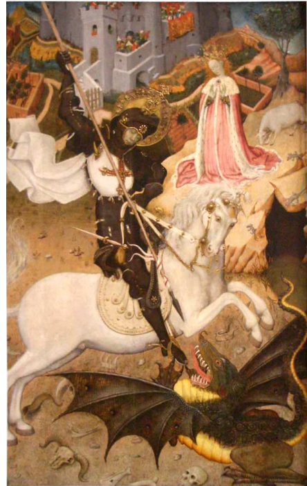
Sant Jordi. Bernat Martorell. S. XV

Quan portava una estona caminant se li va presentar un jove cavaller, cavalcat en un cavall blanc, i amb una armadura tota daurada i lluent. La donzella, esborronada , li digué que fugís de pressa, puix que per allí rondava una fera que així que el veïés en faria xixina . El cavaller li digué que no temés, que no li havia de passar res, ni a ell ni a ella, per tal com ell havia vingut expressament per combatre el monstre, per matar-lo i alliberar del sacrifici la princesa, com també la ciutat de Montblanc del flagell que li representava el veïnatge d'aquell monstre.