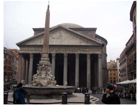
Panteó d'Agripa. s I aC

Tots Sants se celebra el dia 1 de novembre. Aquesta festivitat és una de les més antigues en el món cristià. El seu origen es troba al segle VII, quan el Papa Bonifaci IV, en comptes de fer enderrocar el Panteó de Roma (o sigui el temple pagà de Tots els Déus, que Marc Agripa havia fet construir en honor de Júpiter, en memòria de la victòria de l'emperador August sobre Marc Antoni i Cleopatra, el purificà i consagrà en honor de la Verge i de Tots els Màrtirs , i disposà que cada any fos celebrada una festa en la diada de la seva dedicació.