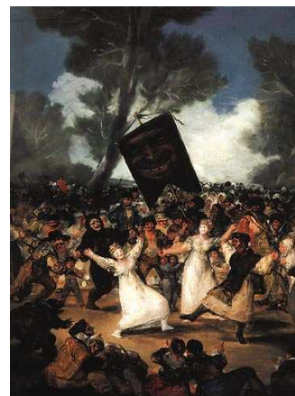
L'enterrament de la sardina. Fco. de Goya. 1814