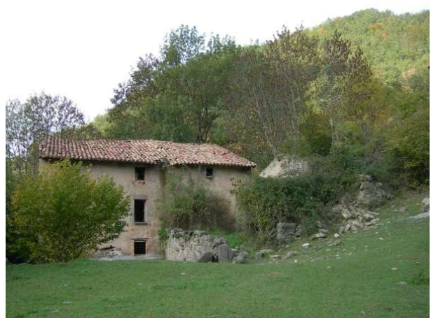
Mas de Salgueda