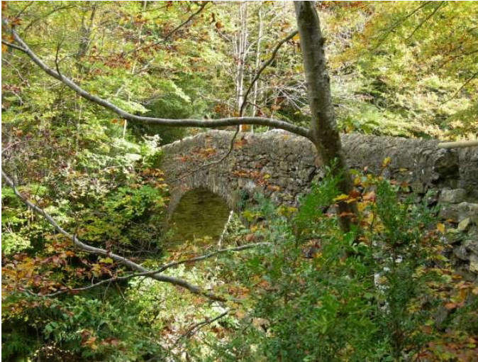
Pont romànic sobre el riu Ges

arribem a un pont romànic sobre el riu Ges, el Pont de Salgueda.