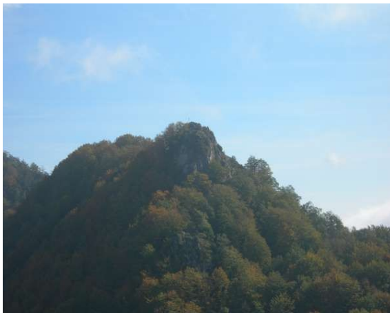
El Puig de les Àligues des del Castell de Curull