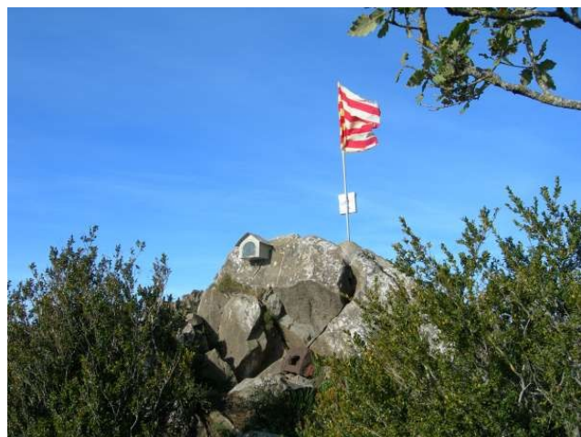
El Puig de les Àligues