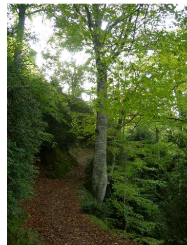
De tornada, creuat el Ges