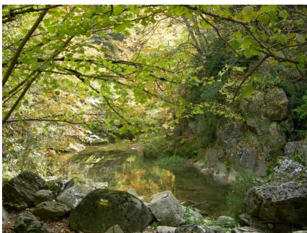
El riu Ges després del Salt del Molí